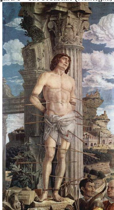
Figura 6 – São Sebastião (Mantegna, 1480)