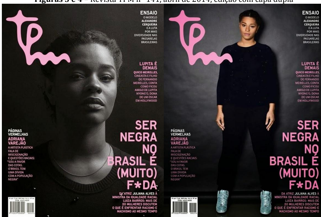
Figuras 3 e 4 – Revista TPM nº 141, abril de 2014, edição com capa dupla