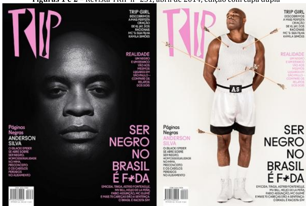
Figuras 1 e 2 – Revista TRIP nº 231, abril de 2014, edição com capa dupla

Um 13 de maio antecipado: edições temáticas, atualidade e memória no circuito TRIP e TPM