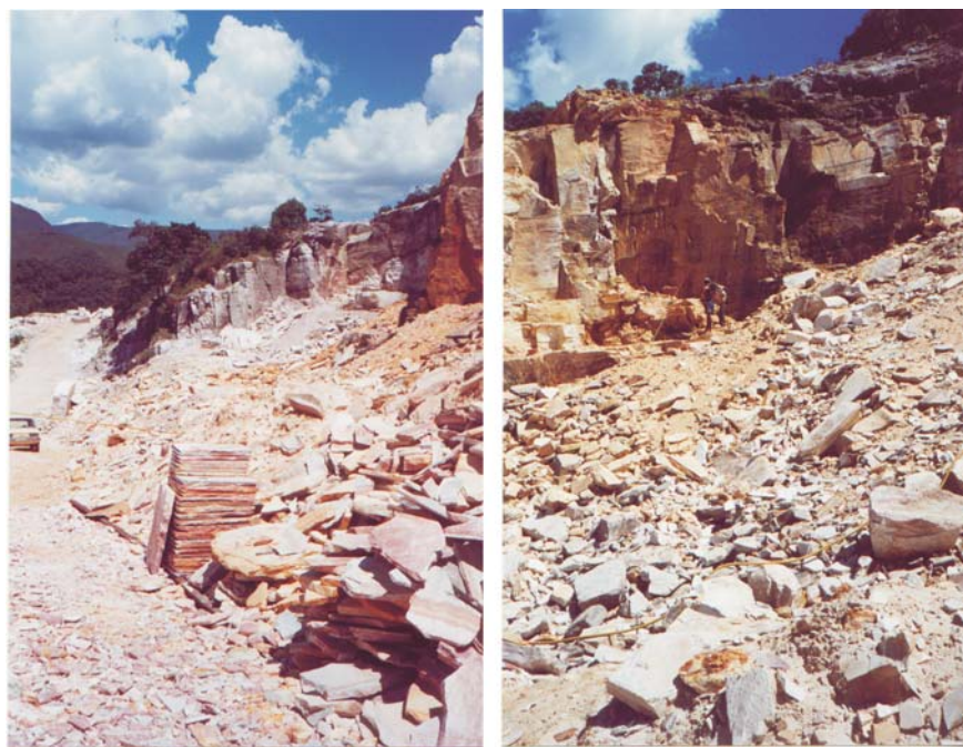
Figura 1 - Fotografias da região do morro do Taquaral de Ouro Preto/MG, mostrando a quantidade de resíduos gerados na atividade (Lima e colaboradores, 2005).

Observa-se que as curvas de distribuição granulométrica das três amostras analisadas apresentam o mesmo padrão, veja Figura 2. O d 80 da amostra A e B é de 0,35 mm. Para a amostra C o d 80 é de 0,42 mm. Cerca de 89,0; 78,5 e 82,0% das amostras A, B e C, respectivamente, encontra-se na faixa granulométrica de 841 a 74 μm (20 a 200 #) e com teores de SiO 2 acima de 88,0% (veja Tabelas 2, 3 e 4), que são as especificações granulométrica e química para areia aplicada em fundição, ou seja, somente com um corte granulométrico, usando as peneiras de 0,841 e 0,074 mm, os resíduos descartados das amostras A, B e C seriam de