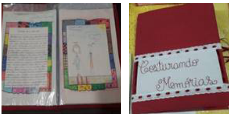
Figuras 6 e 7: Coletânea das memórias literárias

Uma das formas de registrar nossa existência é através da escrita. Todos nós já vivemos histórias para contar: sonhos, medos, travessuras, dentre tantas outras. A docente solicitou aos alunos que recordassem um fato importante ocorrido na infância, registrassem esse fato pela escrita e depois ilustrassem essa lembrança. Fundamentados na teorização bakhtiniana (BAKHTIN, 1997), os alunos foram incentivados a estudar e a refletir sobre a temática, a estrutura composicional e o estilo do gênero memórias literárias, tendo em vista o estágio de desenvolvimento cognitivo da turma.