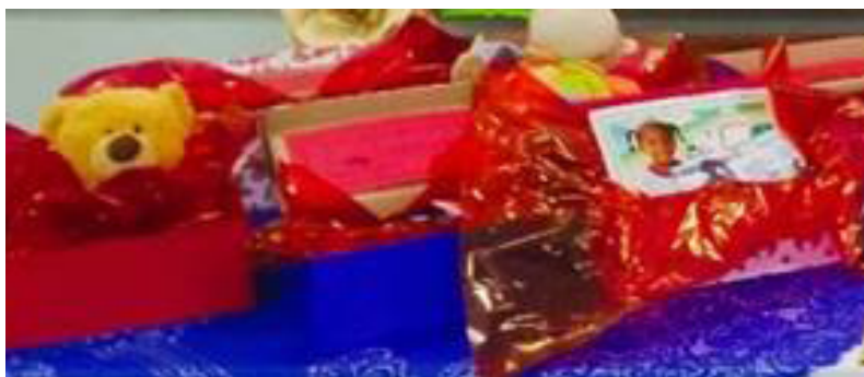
Figura 1: Caixas que os alunos levaram com as lembranças da infância

Neste segundo momento, a professora iniciou a aula novamente com os alunos em círculo e perguntou quem havia levado um objeto que representasse um momento especial da vida deles. Grande parte da turma atendeu ao que foi solicitado e os alunos foram descrevendo e relatando para a turma qual era o significado em sua vida e/ou na vida de sua família daquelas fotos, dos brinquedos, das roupas, dentre outros objetos, conforme fotografia abaixo: