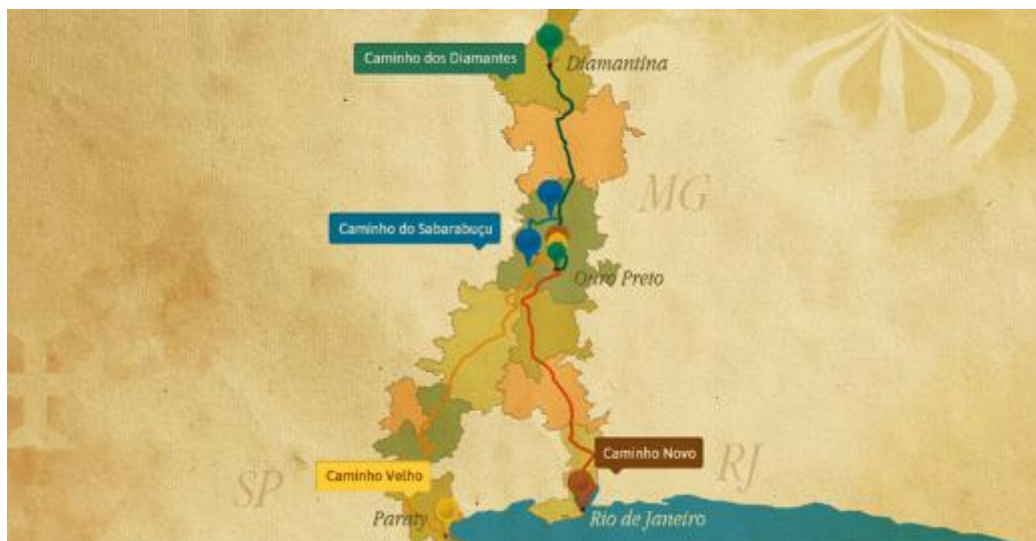
Figura 1: Mapa do Produto Turístico Estrada Real.

Criado pelo Sistema FIEMG em 1999, o Instituto Estrada Real é uma entidade que tem como finalidade organizar, fomentar e gerenciar o produto turístico Estrada Real (Figura 1). Dividido por 4 caminhos distintos e passando pelos estados de Minas Gerais, Rio de Janeiro e São Paulo, esta é considerada a maior rota turística do país implementada a partir dos antigos caminhos “que percorriam vasta área no centro-sul do Brasil, tendo como destino principal a região das minas de ouro e diamante da capitania das Minas Gerais” (SANTOS, 2001).