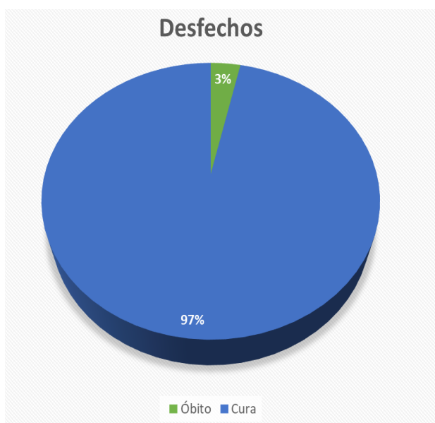
Figura 2. Principais desfechos clínicos pós sepse neonatal por S. agalactiae .

A partir dos estudos avaliados nesta revisão foram avaliados dois desfechos clínicos, óbito e cura, e as taxas encontradas estão demonstradas da Figura 2. Neste estudo a maior parte dos desfechos foi favorável (cura), e estes dados destacam a importância da detecção precoce da colonização por S. agalactiae , principalmente em gestantes, devido às complicações ginecológicas e obstétricas que este patógeno pode provocar, além de, caso tenha a confirmação da colonização, realizar a profilaxia e quando necessário o tratamento de maneira correta (CHAVES, 2011).