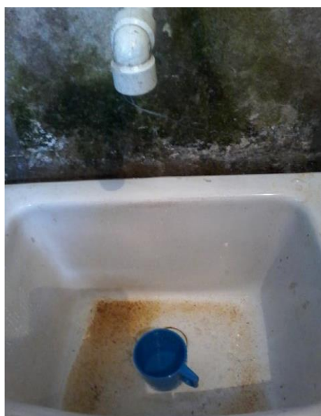
Figura 1- Coleta de água na pia 1