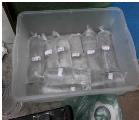
Figura 7- Amostras de água