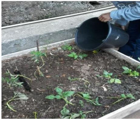
Figura 4- Breno utilizando a água coletada na horta