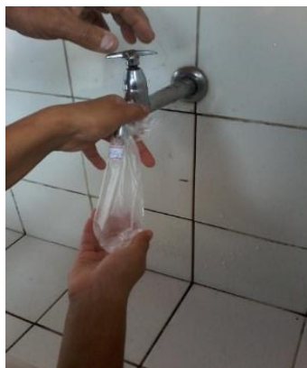
Figura 6- Coleta da amostra