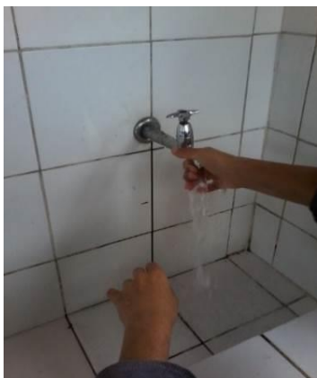
Figura 5- Higienização das mãos e da torneira